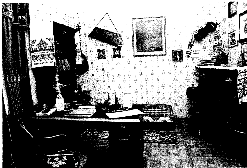
Кабінет Миколи Лисенка. Фото 1912 р. Нинішній вигляд кабінету